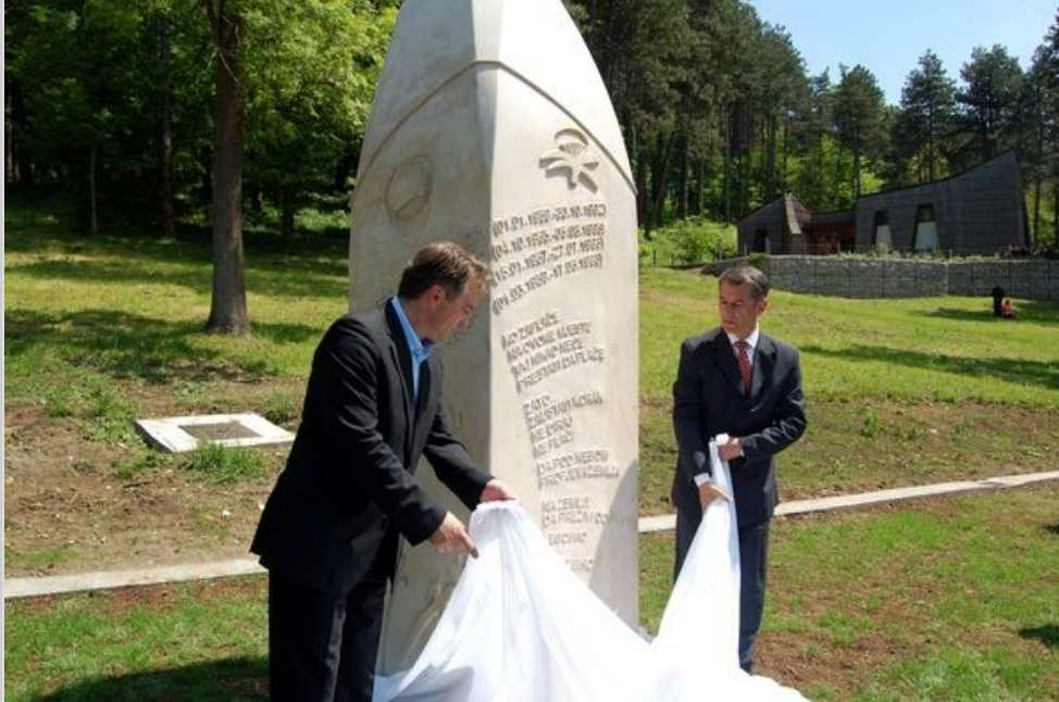
Danas na Slanoj Banji u okviru obilježavanja 9. maja